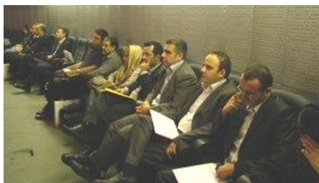
تنی چند از مدیران وسرپرستان شرکت تامین در همایش ملی برترینهای انفورماتیک