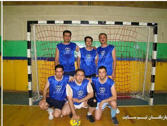
بازیکنان تیم سایت