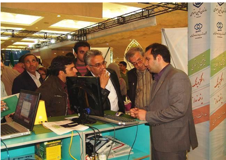
غرفه تامین در هفدهمین جشنواره و نمایشگاه بین المللی مطبوعات و خبرگزاریها