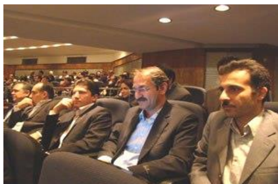
حضور چند تن از سرپرستان و مدیران شرکت تامین در همایش ملی برترینهای انفورماتیک