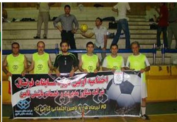
انتخابیه اولین دوره مسابقات فوتبال شرکت مشاور مدیریت و خدمات تأمین تامین