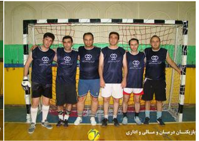
بازیکنان درمان و مالی اداری