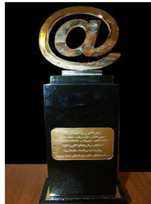
تندیس ویژه اولین همایش ملی برترینهای انفورماتیک و الکترونیک

طی مراسمی با حضور مقامات بلند پایه و دست اندرکاران حوزه فناوری اطلاعات و ارتباطات کشور در مرکز همایشهای بین المللی سازمان صدا و سیما، شرکت مشاور مدیریت و خدمات ماشینی تامین به عنوان "شرکت برتر حوزه فناوری اطلاعات" موفق به دریافت تندیس ویژه اولین همایش ملی برترینهای انفورماتیک و الکترونیک شد