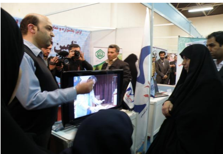
نمایشگاه رسانه های تصویری