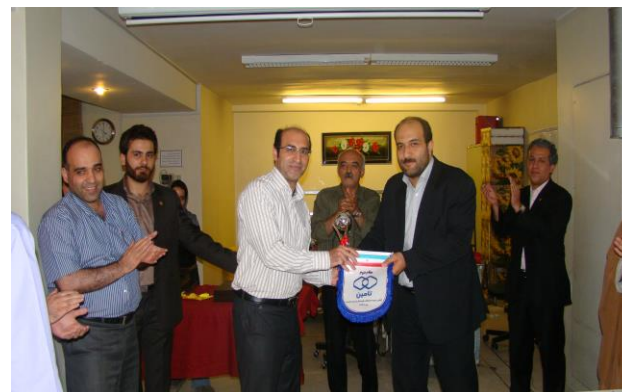
کسب مقام دوم توسط تیم بیمه ای در اولین دوره بازیهای فوتسال شرکت تامین