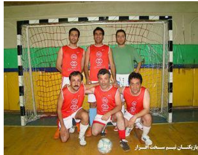
بازیکنان تیم سخت انزار