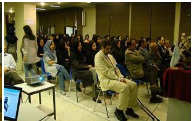
مراسم تقدیر از برگزیدگان مسابقه عکاسی، فوتسال و همکاران کوشا