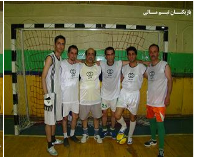
بازیکنان تیم مالی