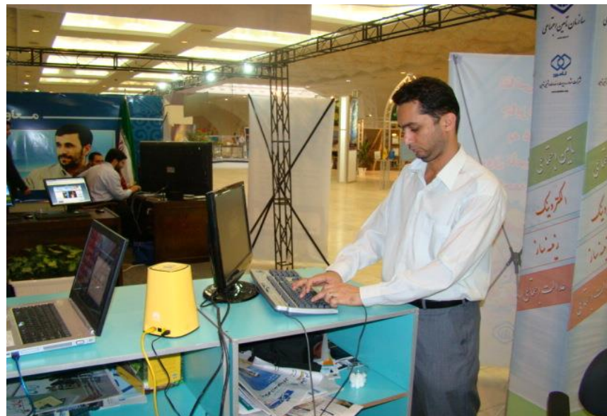
غرفه تامین در هفدهمین جشنواره و نمایشگاه بین المللی مطبوعات و خبرگزاریها