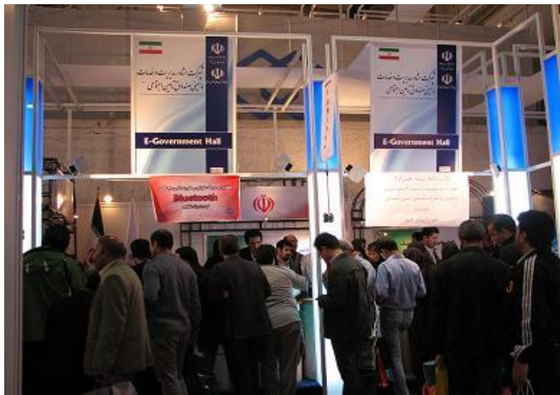
نمایی از غرفه تامین در شانزدهمین نمایشگاه بین المللی ال کامپ ۲۰۱۰