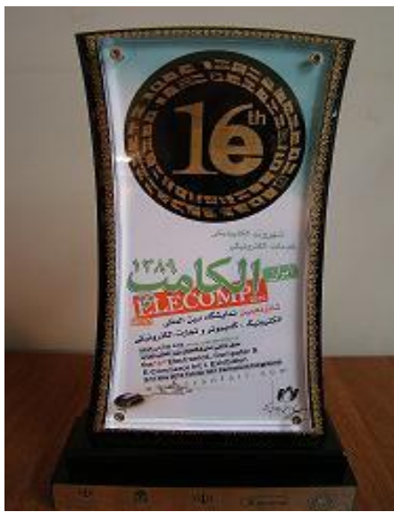
تندیس دستگاه های اجرایی برتر در شانزدهمین نمایشگاه بین المللی ال کامپ

شرکت مشاور مدیریت و خدمات ماشینی تامین به نیابت از صندوق تامین اجتماعی در شانزدهمین نمایشگاه بین المللی ال کامپ ۲۰۱۰ حضور یافت و از بین ۳۲ دستگاه دولتی منتخب، این شرکت به عنوان یکی از سه دستگاه اجرایی برتر در این دوره از برپایی ال کامپ معرفی و طی مراسمی "تندیس دستگاه اجرایی برتر" از سوی معاون فناوری اطلاعات ریاست جمهوری به این شرکت اعطا شد.