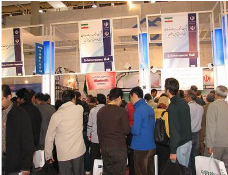
غرفه تامین در ال کامپ ۲۰۱۰