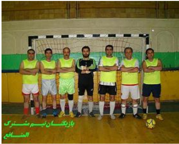
بازیکنان تیم مشترک المنافع