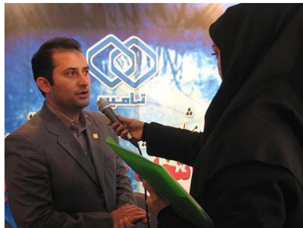
حضور اصحاب رسانه در غرفه تامین ال کامپ ۲۰۱۰