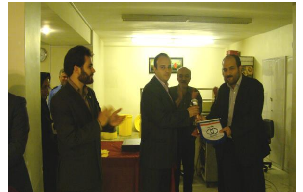
کسب مقام سوم توسط تیم مالی اداری و درمانی در اولین دوره بازیهای فوتسال شرکت تامین