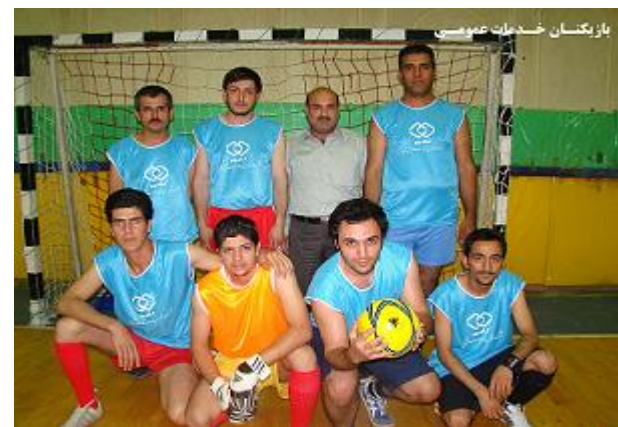
بازیکنان خدمات عمومی