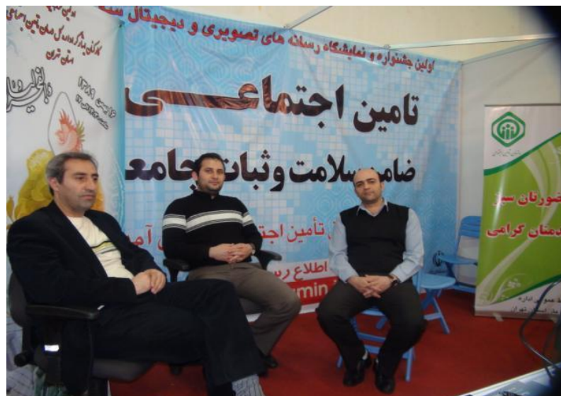
نمایشگاه رسانه های تصویری