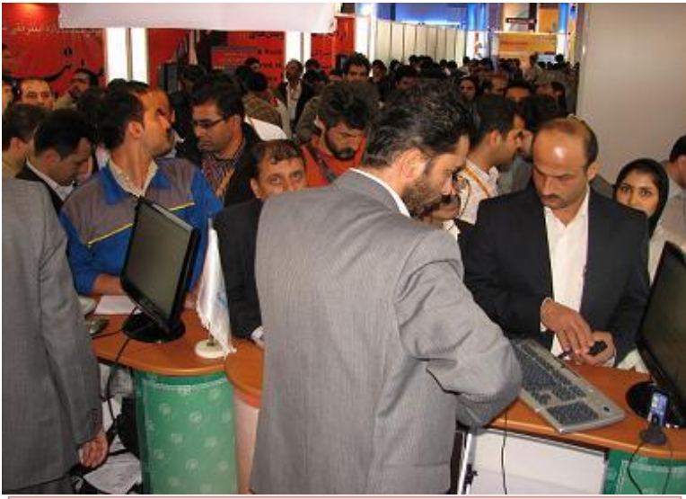
نمایی از غرفه تامین در شانزدهمین نمایشگاه بین المللی ال کامپ ۲۰۱۰