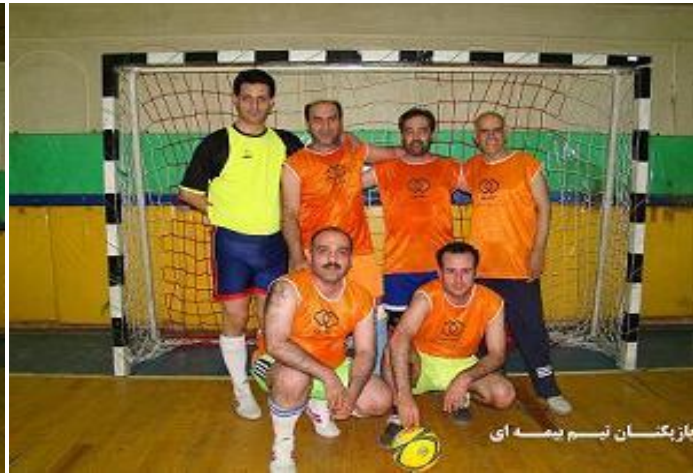
بازیکنان تیم بیمه ای