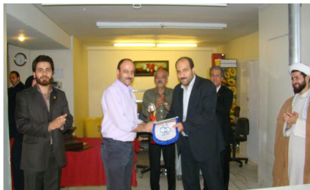
کسب مقام نخست توسط تیم مشترک المنافع در اولین دوره بازیهای فوتسال شرکت تامین